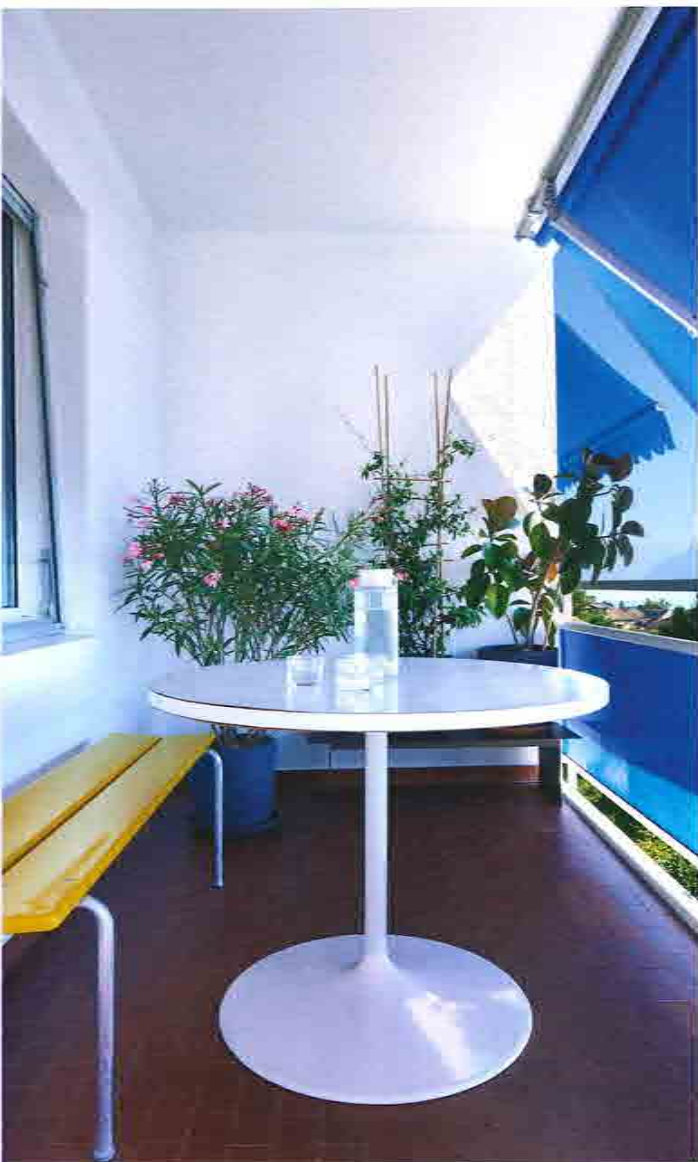
Le balcon bénéficie de la vue sur le lac et les Alpes. Banc Stella Swiss de 1960.

« Les jeux de lumière et de reflets font écho au mouvement du lac proche. »