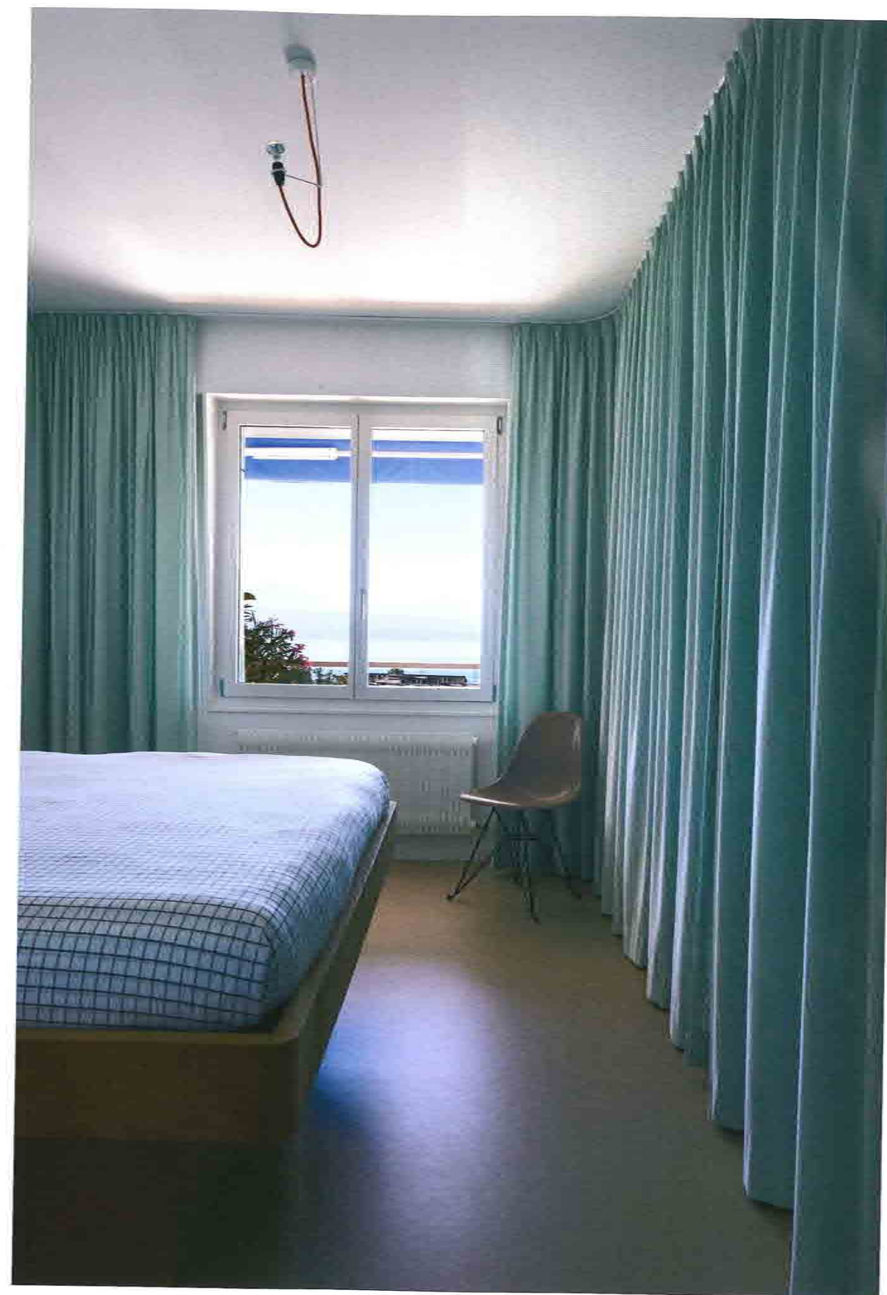
Vue sur le hall depuis la chambre d'amis. Lampe Panthella de Verner Panthon (1971), posée sur une table à roulettes USM Haller. Sérigraphie Échelle de Camille Sauthier (édition Mobylab). Plafonnier Spion de Verner Panton (Verpan). ● Dans la chambre le grand rideau bleu évoque les tons du lac et du ciel. Plafonnier Fabien Cappello, chaise en fibre de verre Charles et Ray Eames, pied Eiffel.