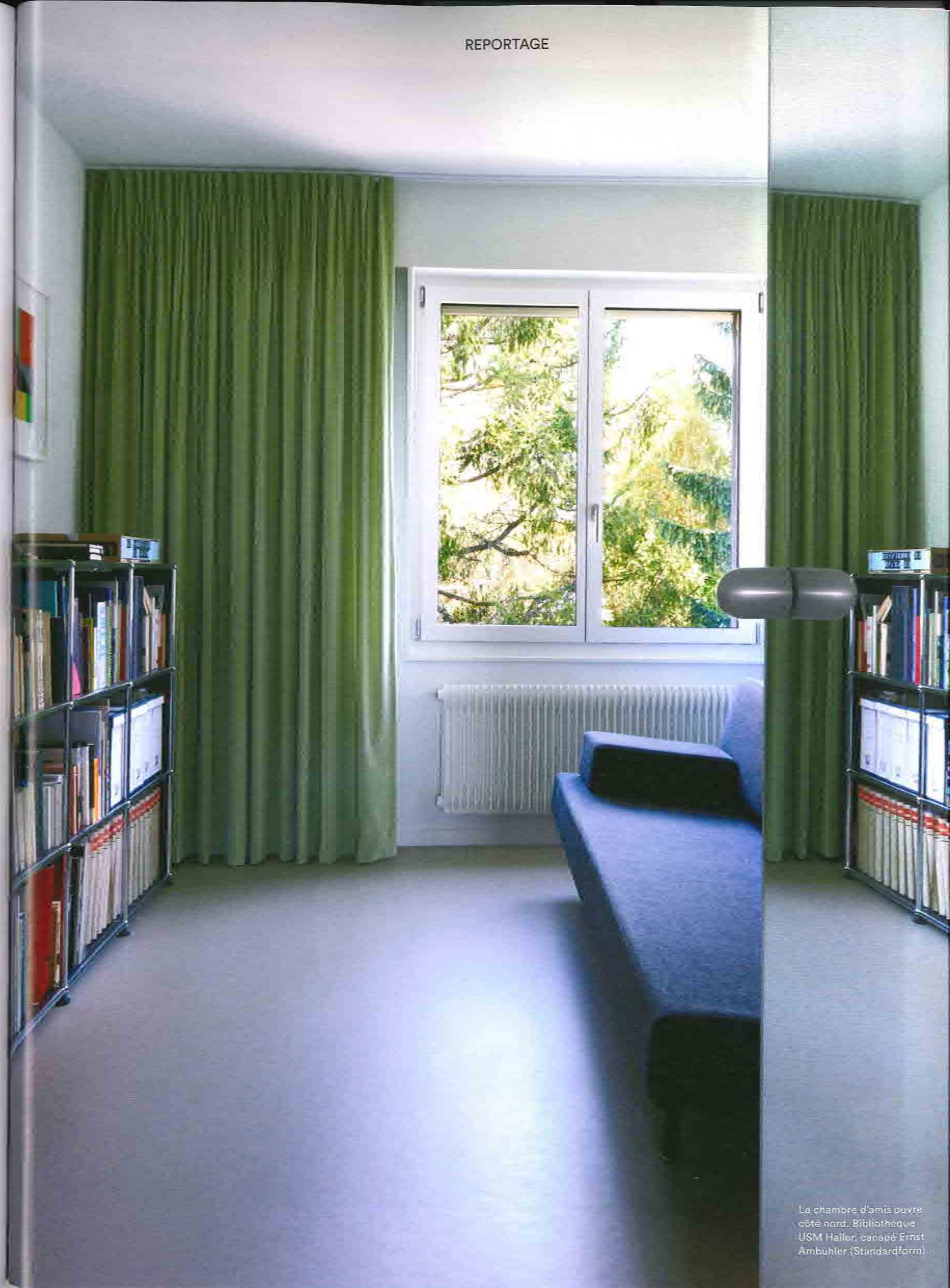
La chambre d'amis ouvre côté nord. Bibliothèque USM Haller, canapé Ernst Ambühler (Standardform).