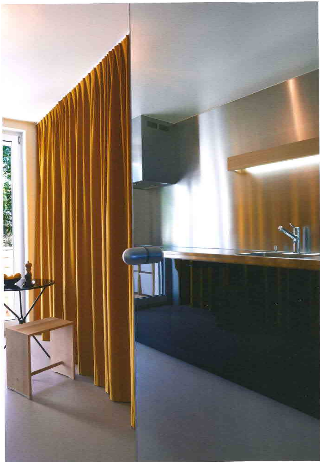
La cuisine laboratoire (TEK cuisines) est prolongée d'un petit balcon. Petite table en métal Cumano de Achille Castiglioni (Zanotta), tabouret ULM de Max Bill (Vitra). ● Le cadre du foyer de cheminée reprend la découpe en diagonale des embrasures de fenêtres. Plafonnier Calotta de Joe Colombo (1964). Table basse Eero Saarinen. Petite table en bois Bella Coffee Table (Hay). Canapé en cuir William de Damian Williamson (Zanotta). ● Dans le sas en face de la salle de bains, meuble USM Haller. Forme géométrique jaune Koerner Union (2006). Bougeoirs/coquetiers de Enzo Mari (Danese, 1972). Sur le mur, une aquarelle sur papier de Michel Rampa. Lampe Parentesi de Achille Castiglioni et Pio Manzù (Flos).